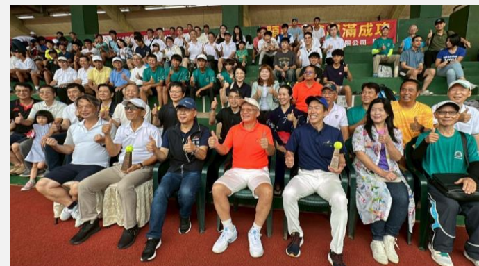
▲ 大雨也澆不熄選手與民眾參與活動的熱情

今年度更邀請到出水市教育長大久保哲志帶領4位14到17歲選手共襄盛舉，台中市運動局謝明儒副局長也代表市長盧秀燕出席典禮，除了為在場的選手們加油打氣，亦持續與日本出水市建立長久友好情誼。活動當天儘管天候不佳，但仍有許多選手與大小朋友到場參與，深深感受到大家對運動的熱情與支持。