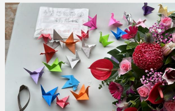
▲ 來自出水市手做紙鶴的友情問候