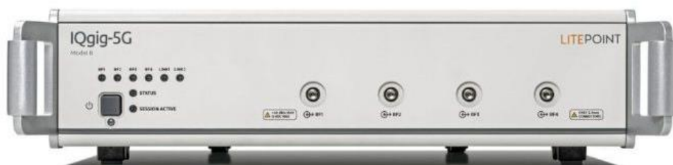
世界首個，也是唯一一個單機測試系統 IQgig-5G

波束成形(Beamforming)是 5G 關鍵技術之一，其量產測試成本昂貴，且專業人才資源稀缺。LitePoint 的大手筆投入，無論從測試硬體設備方面還是專業測試工程師方面，均解客戶燃眉之急。除此之外，該實驗室支持世界知名晶片廠商，提供經驗證通過的測試解決方案。