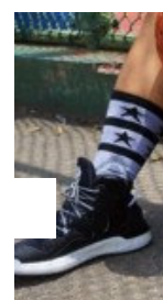
[鞋測] 颶風 by 丁仔