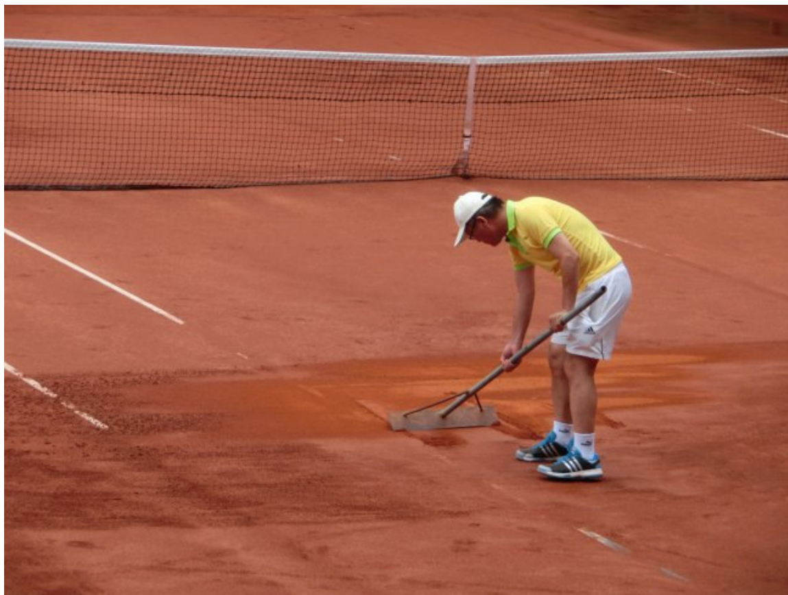
許董事長幫忙整理場地