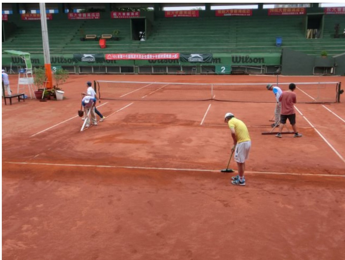
許董事長幫忙整理場地