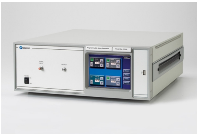
Noisecom J7000 系列

隨著人們對影音傳輸的需求，傳輸資料量的增加，高速傳輸技術(High Speed Interface)相關應用的新產品，不斷地在市場推陳出新，複合傳輸界面合併於一裝置內的干擾問題，也成為研發工程師日常需解決的課題。如何透過現有的測試儀器快速整合出能模擬實際干擾訊號的全方位驗證測試方案，以確保最終產品的品質抗干擾的能力，是工程人員所要面對的挑戰。筑波科技擁有全系列的高速傳輸測試解決方案，讓您能方便快速地驗證您的產品抗干擾之能力，確保產品能符合您客戶的需求。